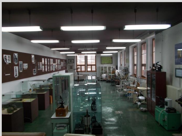
Ogólny widok sali muzealnej