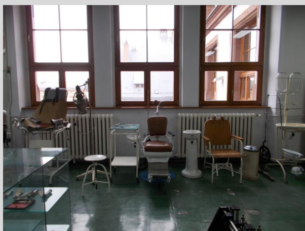
Ekspozycja foteli dentystycznych przełom XIX/ XX w