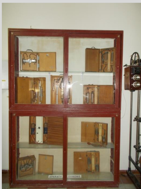
Ekspozycja aparatów oddechowych